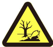
图1 危险废物贮存、处置场警告图形符号

均自 2023 年 7 月 1 日起实施。《规范》将危险废物识别标志分为三大类：危险废物标签，危险废物贮存分区标志和危险废物贮存、利用、处置设施标志。修改单将危险废物贮存、处置场的警告图形符号由“骷髅”改为“枯树和鱼”，可以更为直观地传达“全面防范生态环境风险”的信息，使危险废物贮存和处置设施标志传递的信息更加科学。